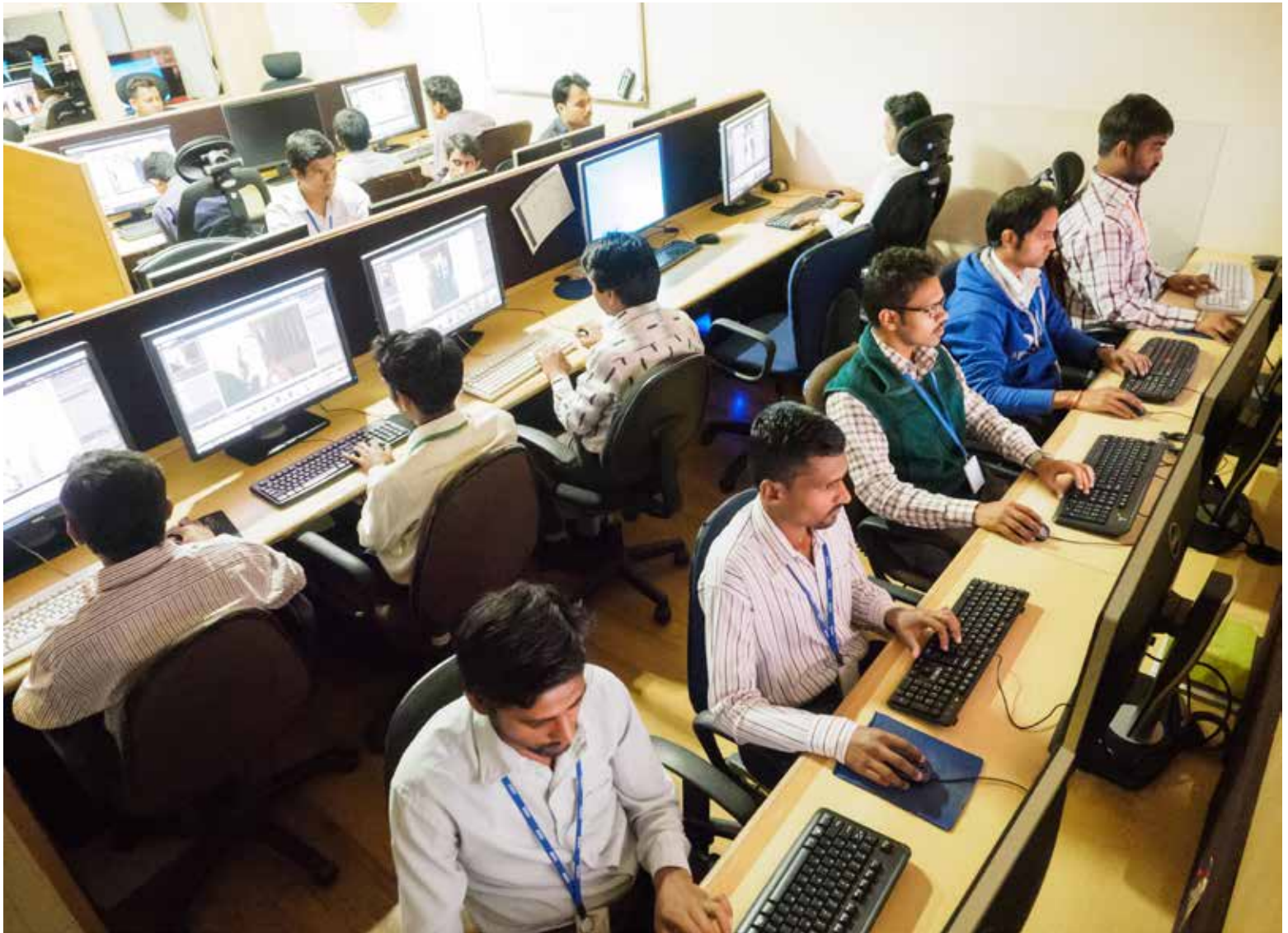
Bildbearbeitung im Hochsicherheitslabor: Kein Rechner hängt am Internet, USB-Sticks sind gesperrt und der Zugang wird mit einem speziellen Kartensystem kontrolliert

Mittlerweile gehört das Outsourcing der Bildbearbeitung in der amerikanischen ‚Wedding-Industry‘ zum guten Ton. Wenn sich zwischen August und Oktober in den USA die Hochzeitspaare die Klinke in die Hand geben, dann arbeiten in Bombay die Bildbearbeiter in drei Schichten an sieben Tagen pro Woche. „Letzten Oktober haben wir in einem Monat 1,6 Millionen Bilder bearbeitet.“ Den Grund, warum Europa dem Trend aus den USA noch hinterher hängt, sieht de Souza darin, dass jeder Fotograf anfangs Angst hat, die Kontrolle über seine Bilder abzugeben. Schließlich werden Hochzeitsfotografen mehr und mehr für ihren spezifischen Bildstil gebucht. Dieser macht sie einzigartig und ist ein wichtiger Wettbewerbsvorteil. Daran will auch de Souza nicht rütteln. 95 Prozent der Bildbearbeitung sind seiner Meinung nach kompletter Standard: Belichtungskorrekturen, Beschnitt, Farben. Erst auf den letzten fünf Prozent entsteht der individuelle Stil des Fotografen. Diesen Stil können seine Bildbearbeiter, gebrieft durch Fotos und Anweisungen des Fotografen, weitestgehend imitieren. Für das,